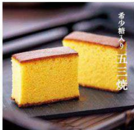
希少糖入り 五三焼