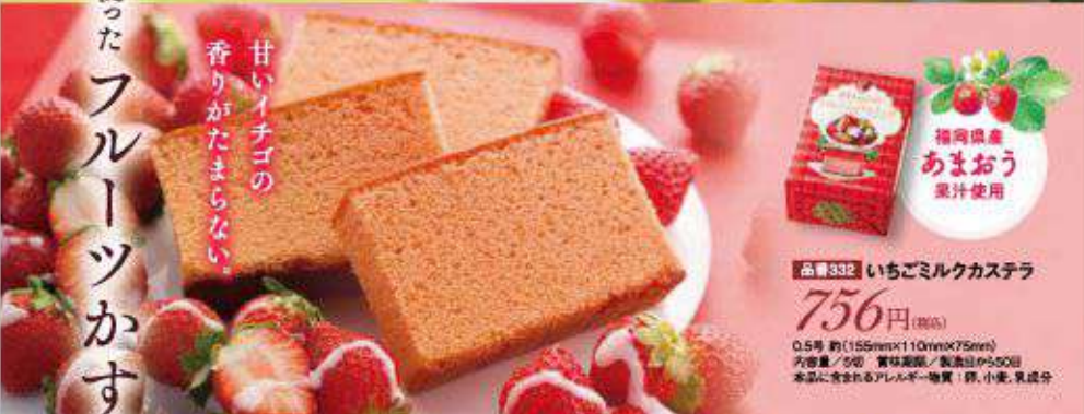
甘いイチゴの 香りがたまらない