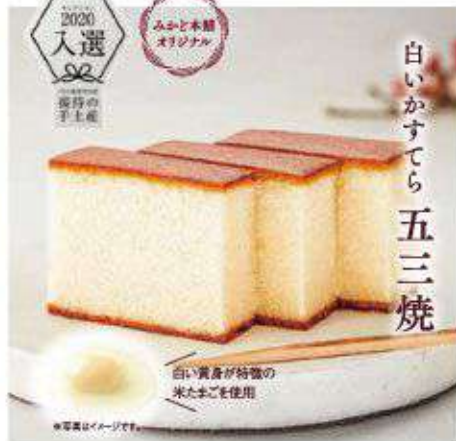
白いかすてら 五三焼

秘書が選んだ至極の逸品。 純白の黄身を持つ稀少な「米たまご」を 五三焼カステラに仕立てました。