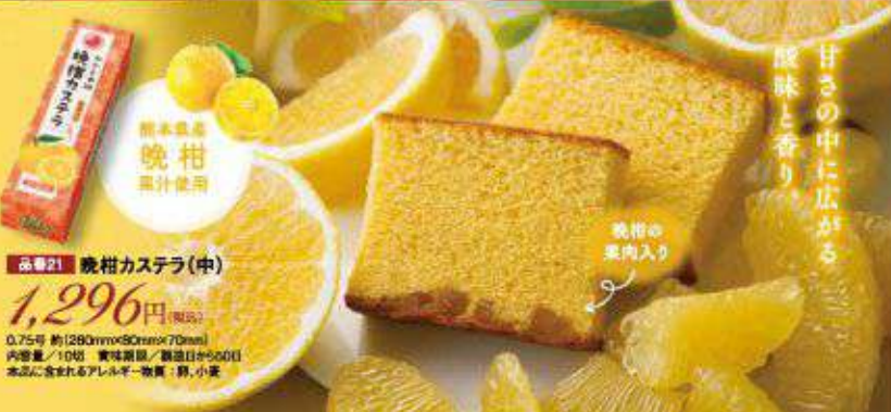
熊本産 晩柑 果汁使用